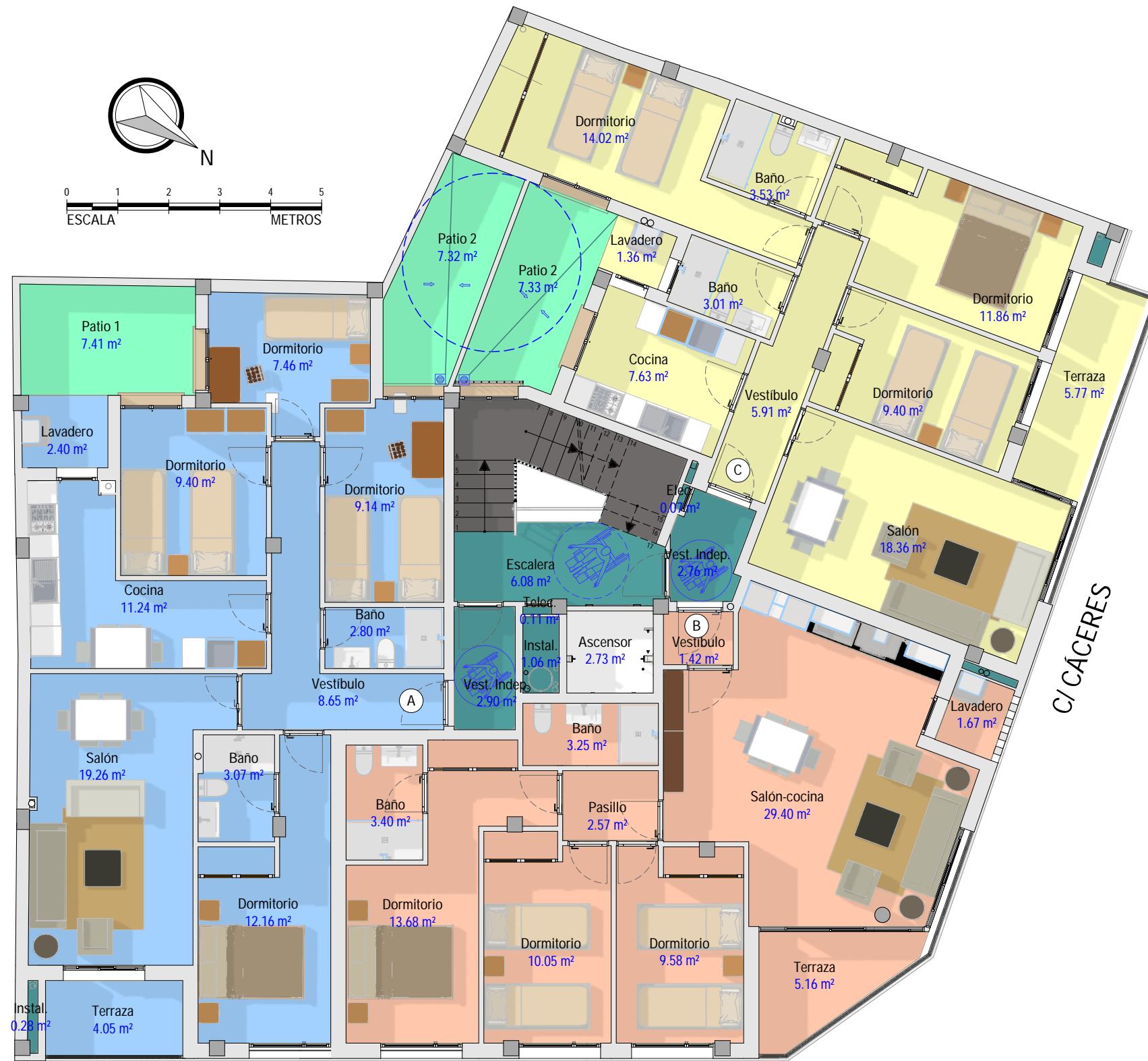
Legenda: ZONAS N1 (SUPERFICIES 3TILES)